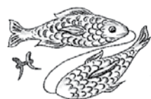
fésscha - vischa