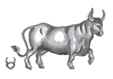
stier - rinn