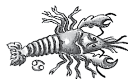
chräbs - chrebs