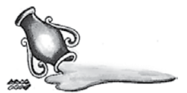
wasserma - wasserma