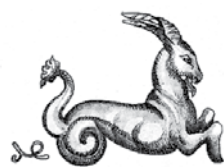
steinbock - steinbockh