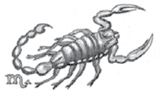
schkorpioan - skrüpiunh